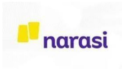
Gambar 2.1 Logo Narasi.tv