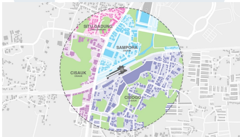
Gambar 1. 2 Kecamatan Dan Desa Yang Ada Pada Wilayah Penelitian

Batasan penelitian berupa batasan atau cakupan lokasi yang akan diteliti dan parameter yang akan digunakan untuk menilai lokasi penelitian. Menurut Peter Calthrope (1993), jarak yang mau ditempuh orang dengan berjalan kaki dalam sebuah kawasan TOD adalah \frac{1}{4} - 1 mil atau kurang lebih 400 – 1600 meter. Maka dari itu, cakupan lokasi yang akan diteliti adalah mencakup radius 400 meter di sekitar Stasiun Cisauk, dimana di dalam cakupan penelitian ini terdapat 2 kecamatan dan 4 desa didalamnya, antara lain: kecamatan Pagedangan yang terdiri dari desa Situ Gadung, serta kecamatan Cisauk yang terdiri dari desa Sampora, Cibogo, dan Cisauk.