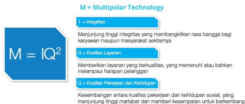
Gambar 2.2. Nilai PT Multipolar Technology Tbk

Selain mempunyai visi dan misi perusahaan ini menunjung kode etik profesional demi tercipta tata laksana dan operasional. Program pelatihan karyawan dan standar mutu ini memastikan tercapainya standar mutu untuk mendorong kepuasan pelanggan. PT Multipolar Technology Tbk menyediakan keseimbangan internal antara beban kerja dan kehidupan dan tercermin dalam nilai sebagai berikut: