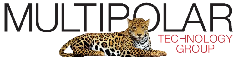
Gambar 2.1. Logo PT Multipolar Technology Tbk