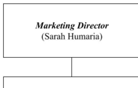
Bagan 2.2 Struktur Organisasi Divisi Key Opinion Leaders