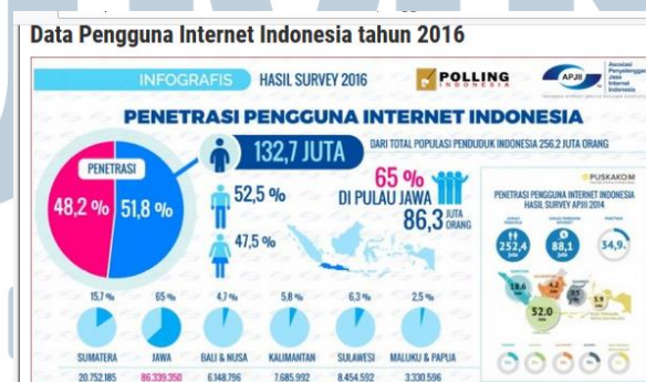
Gambar 1.1 Pengguna Internet Indonesia

Pada 2016, Asosiasi Penyelenggara Jasa Internet Indonesia (APJII) hasil survei jumlah pengguna Internet di Indonesia 2016 adalah 132,7 juta user atau sekitar 51,5% dari total jumlah penduduk Indonesia sebesar 256,2 juta. Pengguna internet terbanyak yaitu di pulau Jawa dengan total pengguna 86.339.350 user atau sekitar 65% dari total penggunaan internet. Jika dibandingkan penggunaan internet Indonesia pada 2014 sebesar 88,1 juta user , maka terjadi kenaikan sebesar 44,6 juta dalam waktu dua tahun (2014 – 2016) (APJII, 2016).