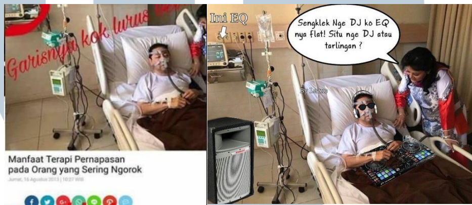
Gambar 1.2 Foto Meme Setnov di Rumah sakit

keterangan dokter, Setya Novanto terkena sakit gula dan tengah menjalani rawat inap di Rumah Sakit Siloam Jakarta. Rencana pemeriksaan Setya Novanto pada 11 September 2017 itu merupakan pemeriksaan pertamanya dalam kasus e-KTP (Taher, 2017).