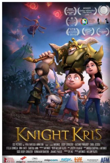
Gambar 2.2. Knight Kris

Berdasarkan dokumen resmi perusahaan Viva Fantasia, Viva Fantasia merupakan studio animasi yang berfokus kepada animasi 3D yang dijadikan sebagai TV series dan juga feature film . Viva Fantasia memiliki visi untuk mampu mendapatkan penghargaan-penghargaan tingkat Asia Tenggara, dapat bersaing dengan studio animasi ternama lainnya, serta dapat menjadi studio animasi internasional. Viva Fantasia juga telah memproduksi beberapa macam film, dan salah satu film yang telah selesai dikerjakan berjudul “Knight Kris” yang memakan waktu 5 tahun lamanya dalam pembuatannya.