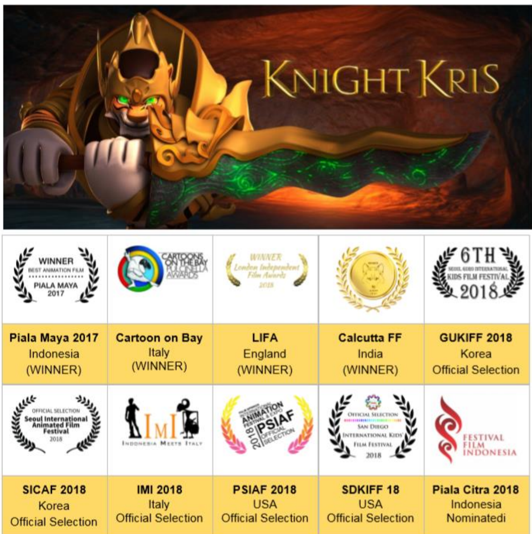
Gambar 2.3. Penghargaan Viva Fantasia

Namun dengan waktu yang cukup lama "Knight Kris" berhasil dirilis pada tanggal 23 November 2017 dan ditayangkan pada bioskop-bioskop seperti XXI, CGV, Rajawali, Flixx, Cinemaxx, dan Platinum. Viva Fantasia juga memperkenalkan "Knight Kris" pada Comic Con Indonesia pada tahun 2016 dengan cara memutar trailer "Knight Kris" di hadapan publik untuk pertama kalinya.