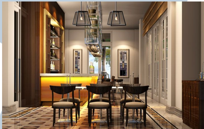
Gambar 2.4 Restaurant