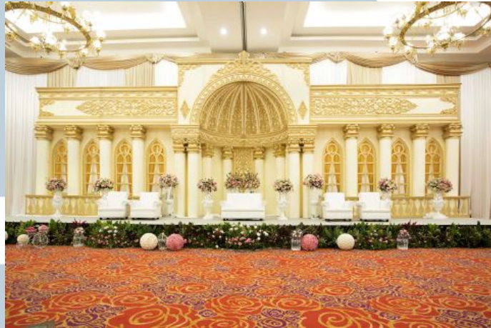
Gambar 2.3. Royal Ballroom