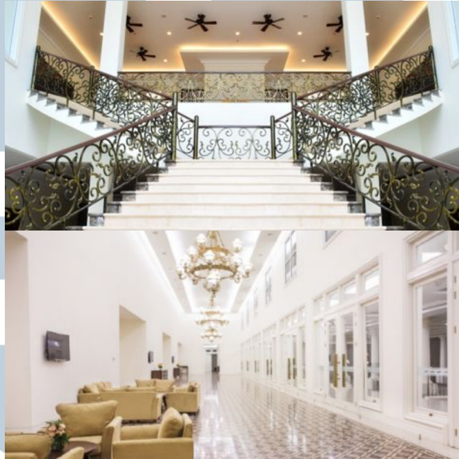
Gambar 2.2. The Springs Club

The Springs Club berlokasi di Jl. Springs Boulevard Blok C No. 1, Gading Serpong, Cihuni, Pagedangan, Tangerang, Banten. The Springs Club adalah klub yang memiliki tempat olah raga yang berstandar internasional, restaurant continental dan asia dengan pemandangan danau, dan Royal Ballroom terbesar dan termegah di area serpong yang dapat memuat 1200 orang lebih.