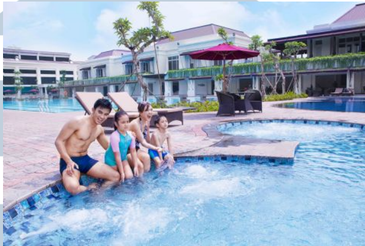
Gambar 2.5. Kolam Renang