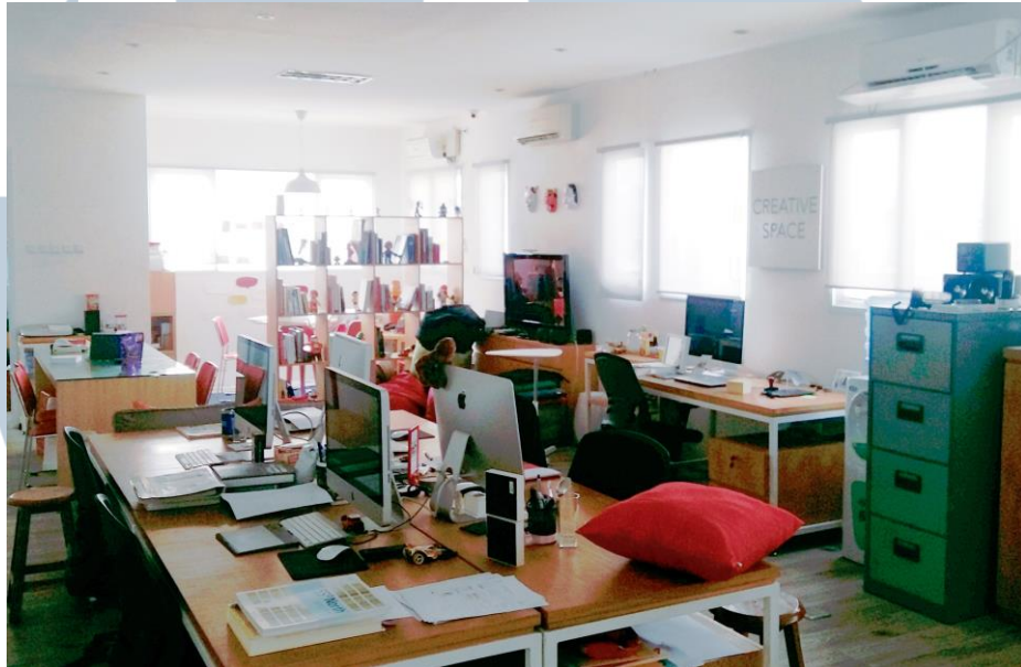
Gambar 2.1. Suasana Kantor JXL Design Co

proyek. JXL Design Co juga selalu menjaga komunikasi yang baik dengan kliennya sehingga menjadi mitra kerja selanjutnya.