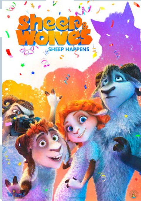
Gambar 2. 5. Sheep & Wolves

Selain mengerjakan serial animasi TV, Supreme VFX juga pernah terlibat dalam pembuatan animasi layar lebar dari Russia yang berjudul Wolf & Sheep.