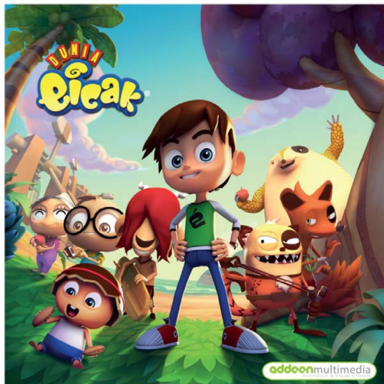
Gambar 2. 2. Dunia Eicak serial animasi TV dari Malaysia

Project yang telah dikerjakan Supreme VFX sebagian besar merupakan serial animasi TV baik dari dalam negeri maupun luar negeri. Beberapa judul serial animasi TV yang telah dikerjakan oleh Supreme VFX sendiri adalah Rabby, Mask Master, Dunia Eicak, dan Rimba.