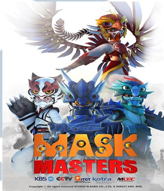
Gambar 2. 4. Mask Master serial animasi TV dari Korea