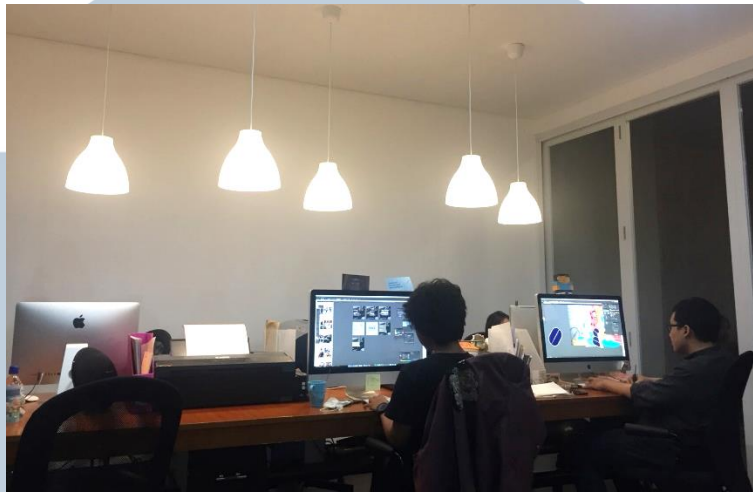
Gambar 2.2. Ruang Kantor Visious Studio di Jalan Rindang Nomor 4, Jagakarsa