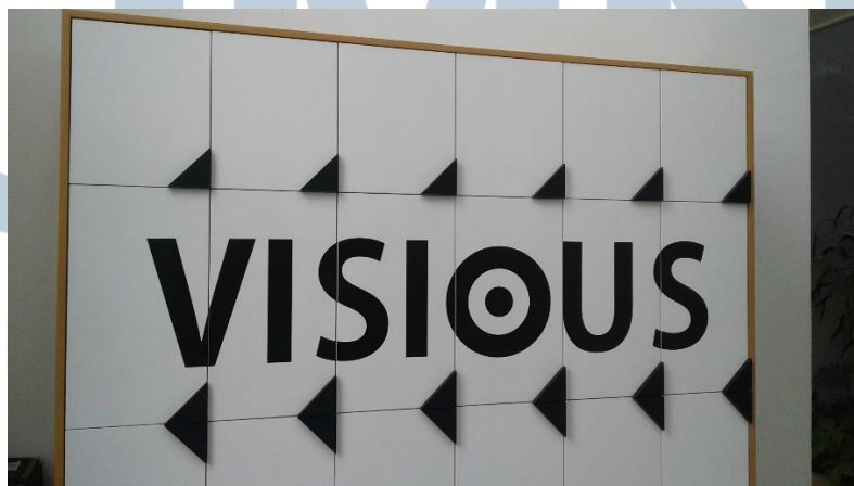
Gambar 2.3. Loker Visious Studio di Jalan Rindang Nomor 4, Jagakarsa