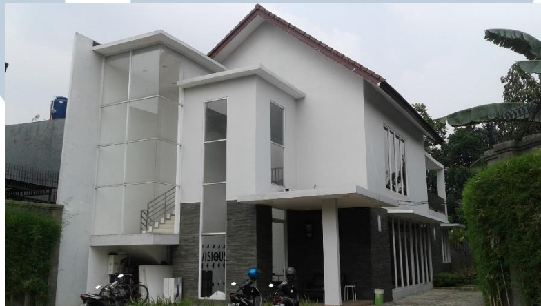
Gambar 2.2. Kantor Visious Studio di Jalan Rindang Nomor 4, Jagakarsa

Kantor Visious Studio pertama kali berlokasikan di Taman Bona Indah B-10 nomor 17. Lalu, Januari 105 Visious pindah ke Taman Bona A6 nomor 44, masih diwilayah yang sama dengan kantor sebelumnya. Kemudian pada Oktober 2016, Visious pindah ke Jalan Rindang Nomor 4, Jagakarsa, Depok.