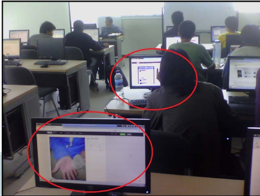
Gambar 1.4 Gambaran Mahasiswa Kurang Termotivasi 4

Kadaan tersebut menimbulkan sebuah tantangan tersendiri bagi ICT Laboratorium UMN mengenai bagaimana cara agar mahasiswa lebih termotivasi dalam melaksanakan kegiatan praktikum. Semenjak tahun 2010 dikenal istilah gamifikasi yang secara harafiah memiliki arti penerapan elemen game design pada konteks non-game (Fitz-Walter, Tjondronegoro, & Wyeth, 2011). Gamifikasi sendiri bersentuhan langsung dengan materi mata kuliah Interaksi Manusia dan Komputer.