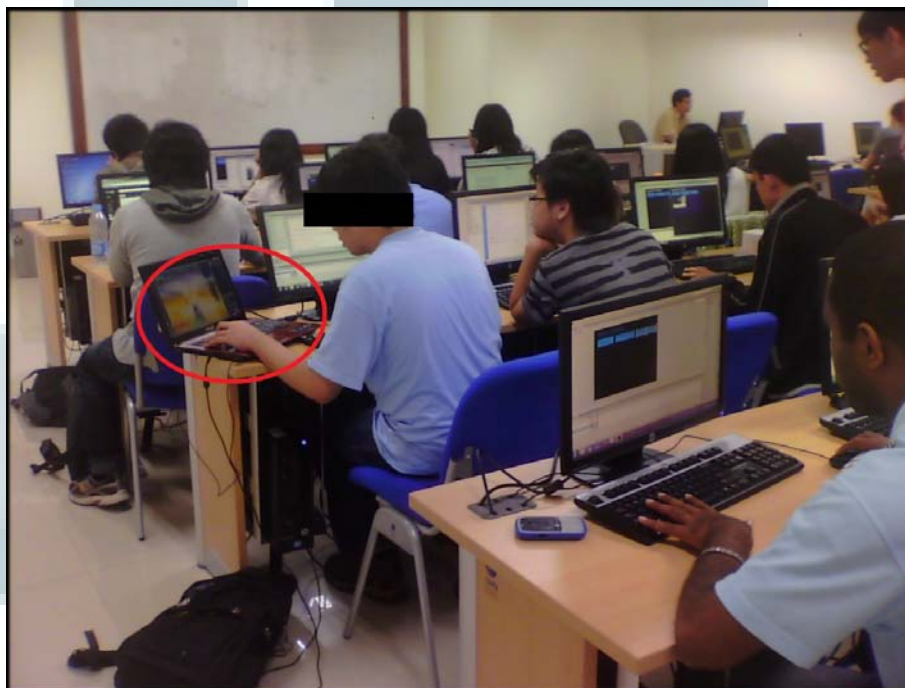
Gambar 1.1 Gambaran Mahasiswa Kurang Termotivasi 1

Namun kenyataannya di Universitas Multimedia Nusantara masih banyak mahasiswa yang kurang termotivasi dalam melakukan kegiatan praktikum dan hanya menganggap sebagai sebuah kewajiban. Hal ini terbukti dengan banyaknya mahasiswa yang ditemukan oleh asisten laboratorium melakukan hal yang tidak bersinggungan dengan kegiatan praktikum seperti membuka situs yang tidak berhubungan dengan kegiatan praktikum, bermain dengan gadget masing-masing, membicarakan hal-hal yang tidak berkaitan sama sekali dengan perkuliahan, dan lain-lain. Gambar 1.1, 1.2, 1.3, dan 1.4 merupakan beberapa gambaran bahwa ditemukan beberapa mahasiswa yang kurang termotivasi dalam kegiatan praktikum komputer.