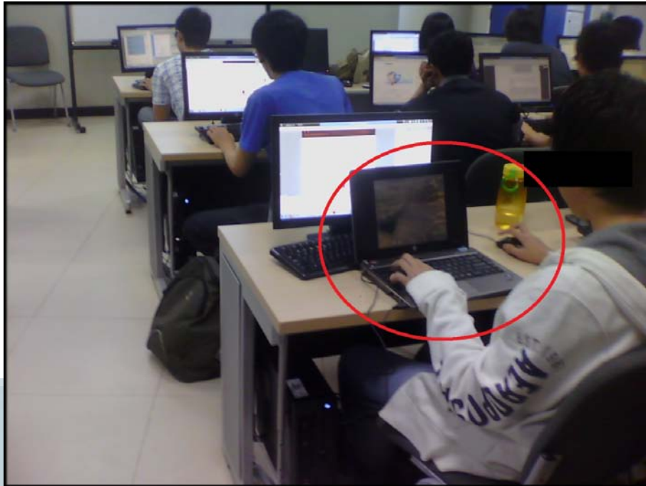
Gambar 1.2 Gambaran Mahasiswa Kurang Termotivasi 2