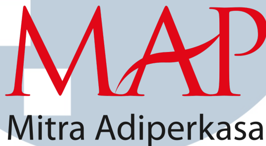
Gambar 2.1. Logo perusahaan Mitra Adi Perkasa

PT. Mitra Adi Perkasa, Tbk berdiri sejak tahun 1995. Mitra Adi Perkasa adalah perusahaan yang bergerak dalam bidang retail yang sudah memiliki lebih dari 2.000 gerai retail dalam bidang sports, fashion, department store, kids, food and beverage , dan juga lifestyle . Tidak hanya di bidang retail , Mitra Adi Perkasa juga merupakan distributor terkemuka untuk merek-merek sports, kids dan juga lifestyle .