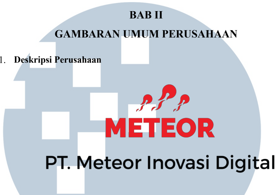
Gambar 2.1. Logo PT. Meteor Inovasi Digital

Perusahaan Meteor terbentuk pada tahun 2014 sebagai suatu usaha yang fokus pada analisa, penilaian, observasi, dan pengembangan platform bagi usaha access economy , untuk memungkinkan terjadinya kolaborasi bisnis, serta mewujudkan sebuah ide bisnis. Perusahaan ini menyediakan kebutuhan-kebutuhan platform digital bagi usaha access economy , sehingga Meteor berkeahlian dalam pengembangan aplikasi, website , business process , serta segala pengelolaan yang termasuk di dalamnya. Pada tanggal 11 Februari 2016, Meteor menjadi sebuah perusahaan bisnis yang legal dengan nama PT. Meteor Inovasi Digital.