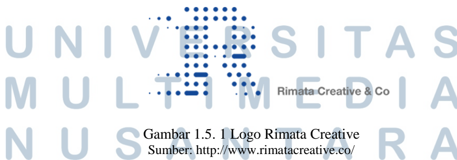
Gambar 1.5. 1 Logo Rimata Creative

experience tentang logo dan periklanan. PT. Rimata Media Indonesia yang berlokasi di GRHA Dhian jalan panjang, kebun jeruk ini telah menangani banyak client-client besar di Indonesia. department, video production, talent (KOL) Agency dan IT Solutions .