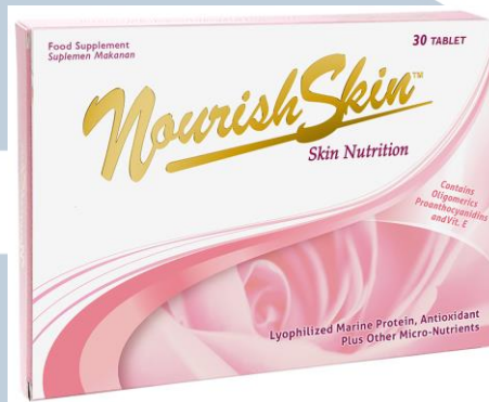
Gambar 2.3. Produk Nourish Skin