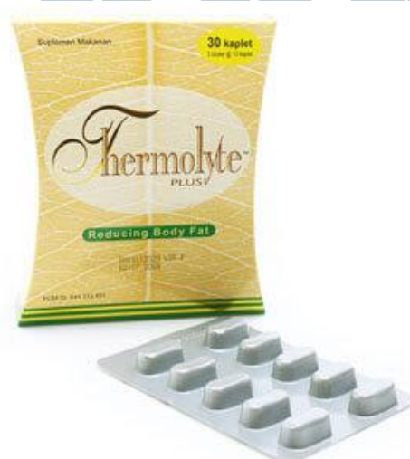
Gambar 2.5. Produk Thermolyte Plus