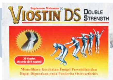
Gambar 2.4. Produk Viostin DS