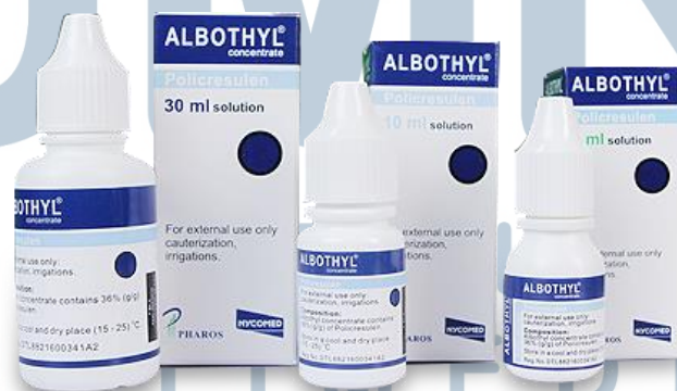
Gambar 2.2. Produk Albothyl Concentrate

PT. PHAROS INDONESIA mempunyai produk yang terkenal baik di kalangan masyarakat. Berikut ini merupakan produk hasil produksi PT. PHAROS INDONESIA antara lain: Nourish Skin, Albothyl Concentrate, Stop-X, Thermolyte Diet Sugar, Medisio Concentrate, Fruit 18/Vegeblend 21 Jr, Fruit 18/Vegeblend For Adults, Omepros, Fishqua, Aclonac Emulsi Gel, Joint Herbal, Chondromax Krim, BeLuna, i-Face, Glunest, Lactokid, Derma Cote, Viostin DS, Illuminare, Polysilane, Proris, Phardex, Narfoz, Neripros, Cholespar, Igastrum, dst.