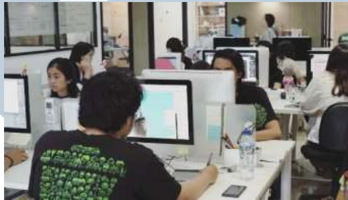
Gambar 2.2. Suasana kantor Kamarupa Design Group

dalam bidang desain grafis, Highstreet Studio bergerak di bidang arsitektur & interior desain, sedangkan Nukegraphic merupakan perusahaan yang bergerak dalam bidang website dan multimedia. Dengan bergabungnya 4 perusahaan ini, Kamarupa Design Group dapat melebarkan sayapnya untuk memenuhi kebutuhan pasar dalam perancangan branding , graphic design , photography , videography , arsitektur & interior desain, digital marketing , hingga website dan pengembangan aplikasi mobile . Kamarupa Design Group juga memiliki visi untuk menjadi rekan bisnis yang bermutu dan konsultan kreatif untuk para kliennya.