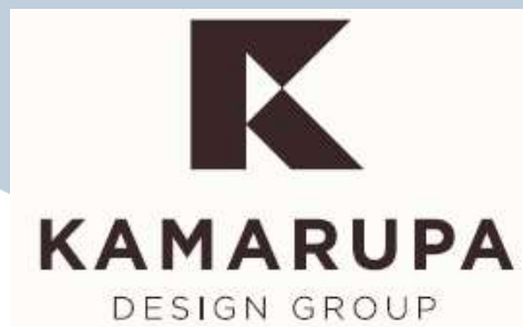
Gambar 2.1. Logo perusahaan Kamarupa Design Group

Kamarupa Design Group adalah sebuah perusahaan yang bergerak dalam bidang branding consultant yang berlokasi di Jalan Palmerah Utara 2 no. 201 AA, Palmerah, Jakarta Barat, Jakarta 11480. Nomor teleponnya adalah 021-53661256. Selain itu, Kamarupa Design Group juga memiliki alamat website yaitu www.kamarupa.co.id yang berisikan informasi, about , portfolio , service , klien, blog, sampai kontak yang senantiasa dapat dikunjungi oleh calon klien, klien ataupun mitra usaha.