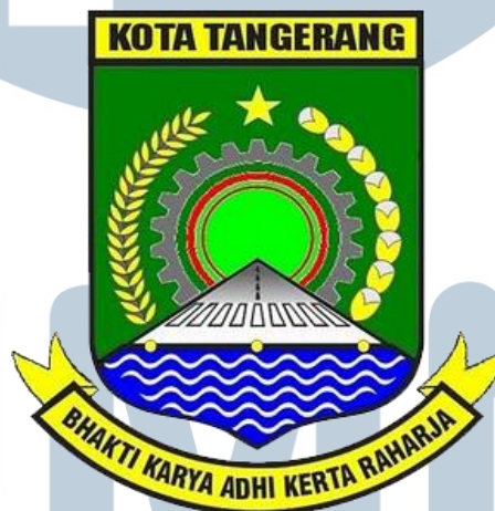
Gambar 2.1 Lambang Kota Tangerang

Dinas Informasi dan Komunikasi dibentuk berdasarkan Peraturan Daerah Kota Tangerang Nomor 5 Tahun 2008 Tentang Pembentukan dan Susunan Organisasi Dinas Daerah serta Peraturan Walikota Tangerang Nomor 28 Tahun 2008 Tentang Organisasi dan Tata Kerja Dinas Informasi dan Komunikasi Kota Tangerang yang mempunyai tugas pokok yaitu untuk melaksanakan sebagian urusan pemerintahan daerah di bidang informasi dan komunikasi berdasarkan asas otonomi dan tugas pembantuan.