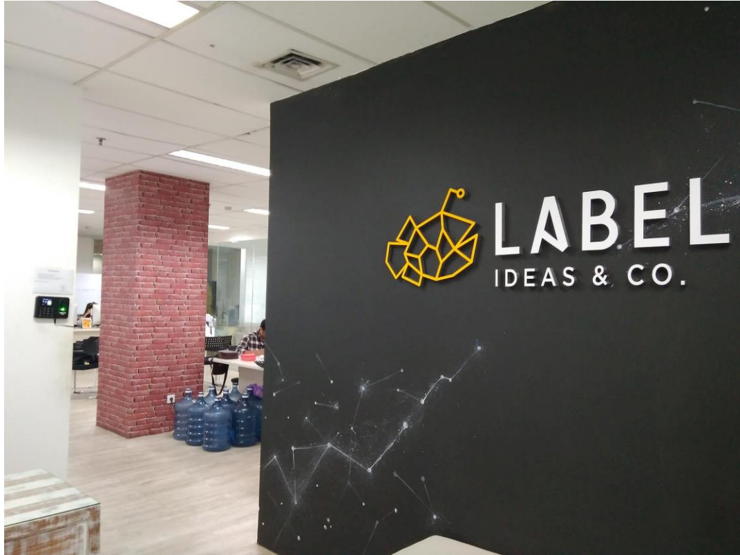
Gambar 2.1 PT. Label Inovasi Indonesia

Gambar diatas merupakan gambar dimana kantor tempat penulis melakukan kerja magang, Tempat itu terletak di lantai 7 menara danamon atau yang sekarang bernama Gedung RDTX.