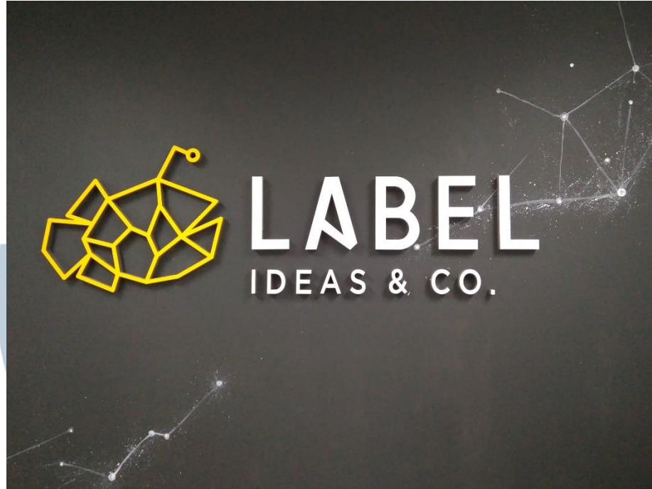
Gambar 2.2 Logo perusahaan

Mereka menggunakan ikan pemancing sebagai logo mereka sebagai penanda bahwa mereka akan menerangi jalan brand produk yang mereka kerjakan, sehingga produk tersebut dapat dikenal oleh banyak konsumen dengan metode yang efisien.