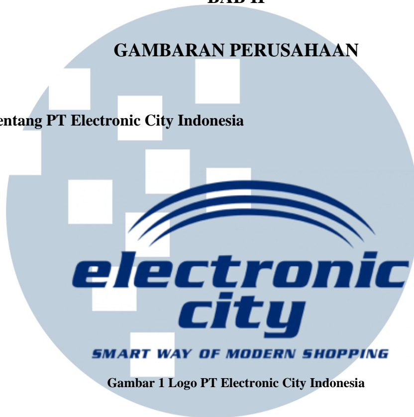
Gambar 1 Logo PT Electronic City Indonesia

PT Electronic City Indonesia Tbk. (disingkat ECI) adalah perusahaan penjual produk elektronik yang didirikan pada tanggal 1 November 2001. Perusahaan ini merupakan salah satu penjual elektronik terbesar di Indonesia. Electronic City menjadi pelopor retail elektronik modern di Indonesia dengan membuka toko Standalone sekaligus toko pertama ( flagship store ) di Sudirman Central Business District (SCBD). Electronic City memperluas jaringan toko di luar Jabodetabek dengan membuka toko pertama di Denpasar pada tahun 2004 dan di Sumatera yang terletak di Medan, Sumatera Utara pada tahun 2007.