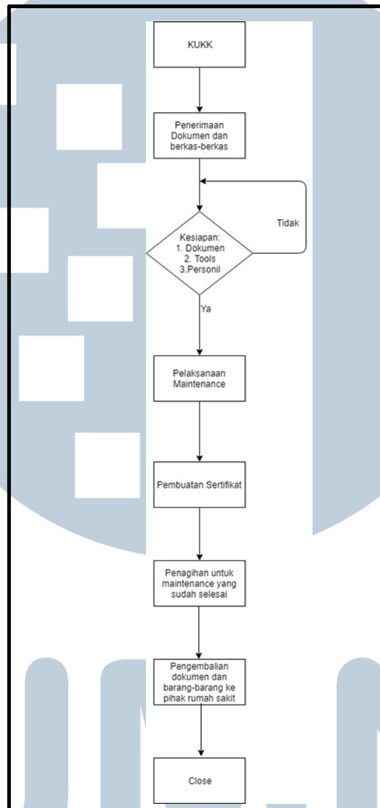
Gambar 2.4 Alur Proses Bisnis di Perusahaan