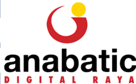
Gambar 2.1. Logo PT. Anabatic Solusi Digital

Nama Anabatic berasal dari bahasa Yunani klasik, Anabatikos secara harfiah berarti hasrat untuk bergerak maju agar menjadi lebih baik (lihat filosofi Kaizen di bawah). Arti alternatif Anabatikos adalah terampil dalam pemasangan atau kemampuan dalam mencapai tempat yang lebih tinggi.