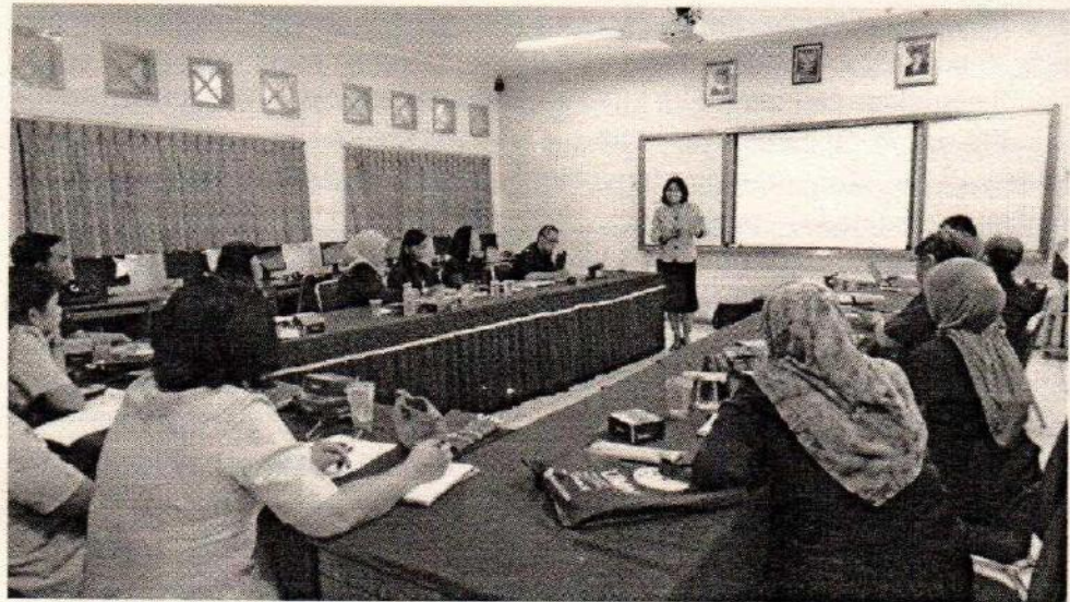
Gambar 2 : Pelatihan ke 2 Literasi Media Baru

Jenkins (2006) menyatakan bahwa sifat teknologi yaitu interaktivitas mendorong munculnya budaya partisipatif. Jenkins (2006) memaparkan bahwa budaya partisipatif adalah budaya dimana orang-orang (baik sebagai pribadi maupun publik) tidak dapat bertindak sebagai konsumen saja, tetapi juga menjadi kontributor atau produser (prosumers). Internet memungkinkan orang secara pribadi untuk menciptakan dan mempublikasikan media melalui internet. Budaya baru ini menghubungkan internet yang digambarkan sebagai web 2.0. Dalam budaya partisipatif 'orang-orang muda secara kreatif merespon signal-signal elektronik dan komoditas-komoditas budaya'. Bentuk-bentuk budaya komunikasi partisipatif menurut Jenkins : 1) Afiliasi – keanggotaan formal dan informal dalam kelompok atau komunitas online seperti facebook, twitter ataupun mailing list; 2) Ekspresi – menghasilkan bentuk-bentuk kreatif baru seperti fan fiction; 3) Penyelesaian Masalah Kolaboratif – bekerjasama dalam tim, formal dan informal – untuk melengkapi tugas dan mengembangkan pengetahuan baru (misal melalui Wikipedia); 4) Sirkulasi – membentuk aliran media (seperti podcasting atau bogging).