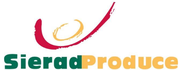
Gambar 2.1 Logo Perusahaan

PT Sierad Produce, Tbk (“Sierad Produce”) didirikan pada tanggal 6 September 1985 dengan nama PT Betara Darma Export Import. Pencatatan saham perdana di Jakarta Stock Exchange pada tahun 1996 dan telah menjadi salah satu perusahaan peternakan unggas terpadu di negeri. Sierad Produce fokus pada inti kompetensinya, yaitu produksi pakan ternak, produksi anak ayam umur sehari (“DOC”), peternakan ayam komersial, contract growing , pemotongan ayam dan produksi makanan olahan dan produk ayam bernilai tambah. Visi Sierad Produce adalah menciptakan timbal balik berkesinambungan yang dapat diterima oleh para pemegang saham dengan menjadi perusahaan peternakan unggas terpadu berbasis makanan terkemuka di Indonesia.