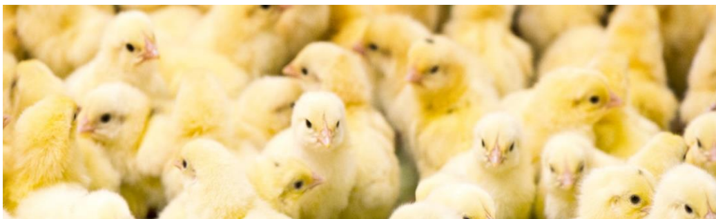
Gambar 2. 4 Bibit Ayam