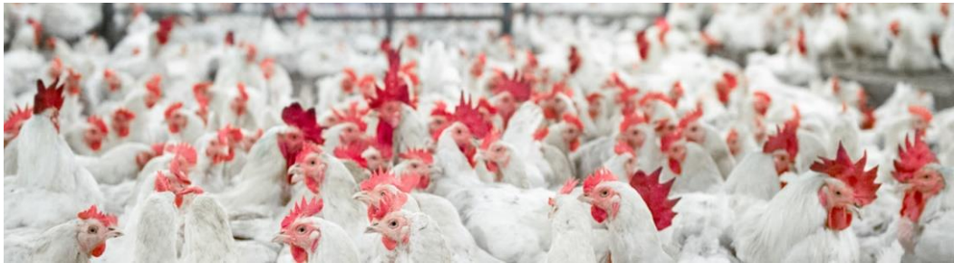
Gambar 2. 5 Ayam Siap Potong