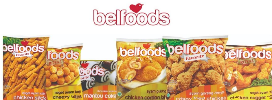
Gambar 2. 7 Produk Siap Saji