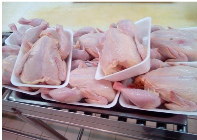
Gambar 2. 6 Ayam Potong