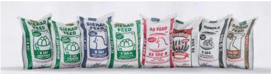
Gambar 2. 3 Pakan Ternak