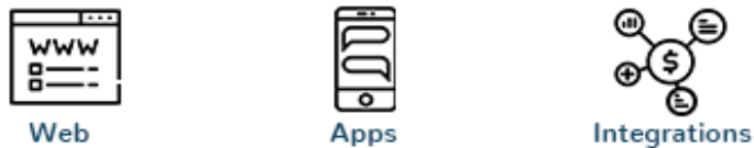
Gambar 2. 2 Spesialisasi PT. Fiture Teknologi Inovasi

PT. Fiture Teknologi Inovasi memiliki spesialisasi pada custom solution yang dimana mereka membuat semua sistemnya sendiri, yang juga dapat menerima keinginan client ataupun customernya seperti yang mereka mau, baik dari sisi modul, front end , back end maupun API. Selain itu, mereka juga memiliki beberapa produk layanan yang dikembangkan seperti FI-FA(Fiture Sales Force Automation) yaitu sistem yang memproses aktivitas penjualan pada sebuah bisnis secara otomatisasi, Fi-RP(Enterprise Resources Planning) yaitu sistem informasi untuk perusahaan manufaktur/jasa yang berperan mengintergrasikan dan mengotomatisasikan proses bisnis, Fi-Merces(B2C & B2B e-Commerces Platform) yaitu platform E-commerce yang dapat dihubungkan pada sistem terpadu yang dapat dikelola melalui sales forces dan CRM , dan Fi-Solus(Custom Software Solution) yaitu sebuah customization pada aplikasi yang sesuai dengan keinginan client/customers .