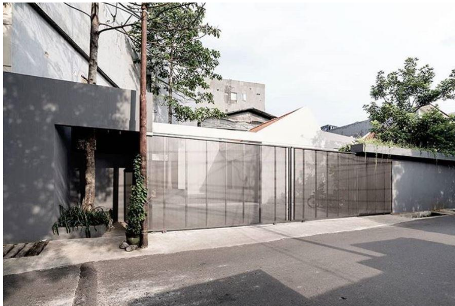
Gambar 2.2 Area depan kantor PT. Gubah Estetika Tata Sinergi

Dalam proses desain, Gets Architects selalu menjaga komunikasi dan memposisikan klien sebagai bagian dari tim agar setiap desain dan ide yang dihasilkan merupakan hasil dari pemikiran bersama dan mengetahui batasan batasan apa saja yang dimiliki. Dengan mengeksplorasi ide, kebutuhan, keinginan, penyesuaian lingkungan dan batasan yang dimiliki, desain yang dihasilkan akan lebih potensial dan menjawab tantangan yang ada sehingga akan berbeda dengan desain desain lainnya (Gets Architects, 2019).