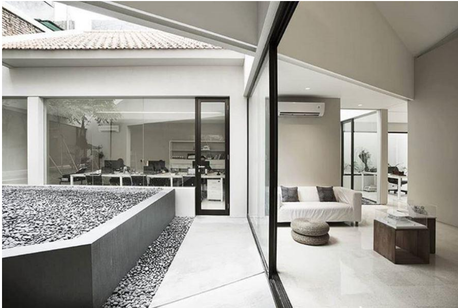
Gambar 2.3 Area dalam kantor PT. Gubah Estetika Tata Sinergi