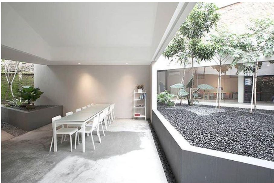
Gambar 2.4 Area makan PT. Gubah Estetika Tata Sinergi