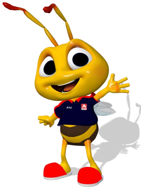
Gambar 2.2. Maskot PT. Midi Utama Indonesia Tbk.