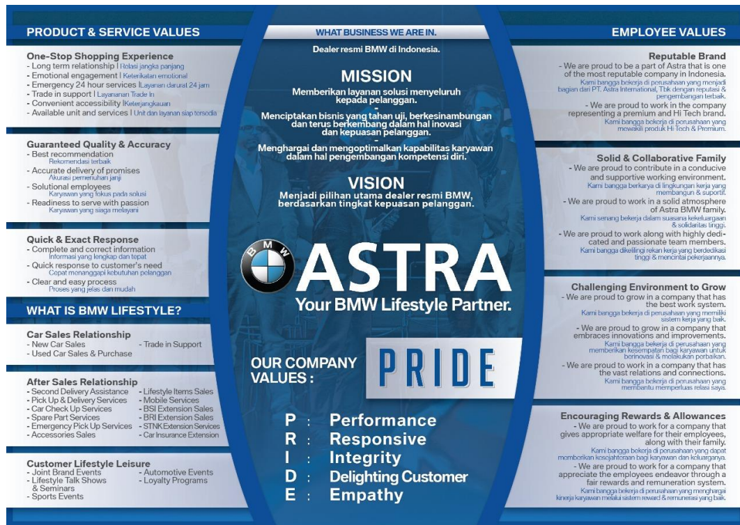
Gambar 2.2. Company Profile PT. Astra International, Tbk – BMW Sales Operation (BMW Astra)