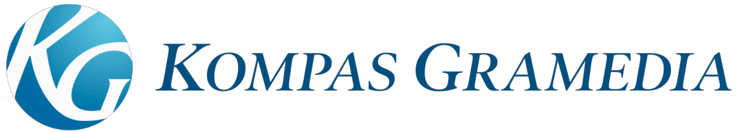
Gambar 2.1. Logo Kompas Gramedia

Perusahaan Kompas Gramedia memiliki visi dan misi “Menjadi Perusahaan yang terbesar, terbaik, terpadu, dan tersebar di Asia Tenggara melalui usaha berbasis pengetahuan yang menciptakan masyarakat terdidik, tercerahkan, menghargai kebhinekaan, dan adil sejahtera.” (“Visi dan Misi | Kompas Gramedia”, N.d.).