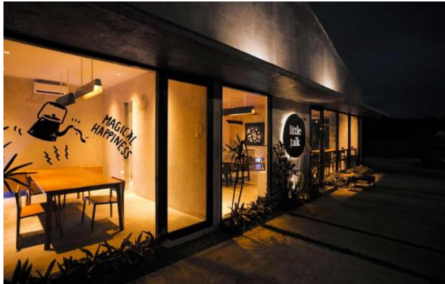
Gambar 2.5 Enviromental Design Little Talk