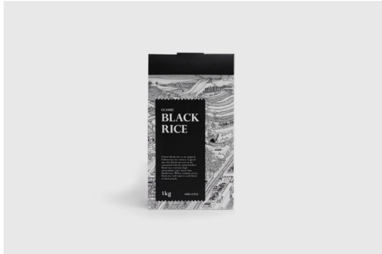
Gambar 2.5 Packaging the Land of Banyuwangi