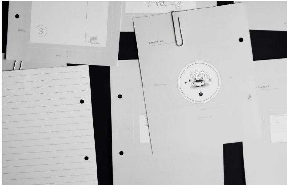
Gambar 2.6 Grafis Threeology