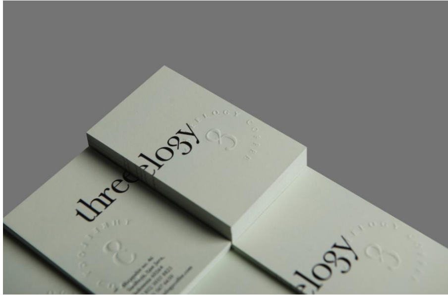
Gambar 2.7 Desain Kartu Threeology