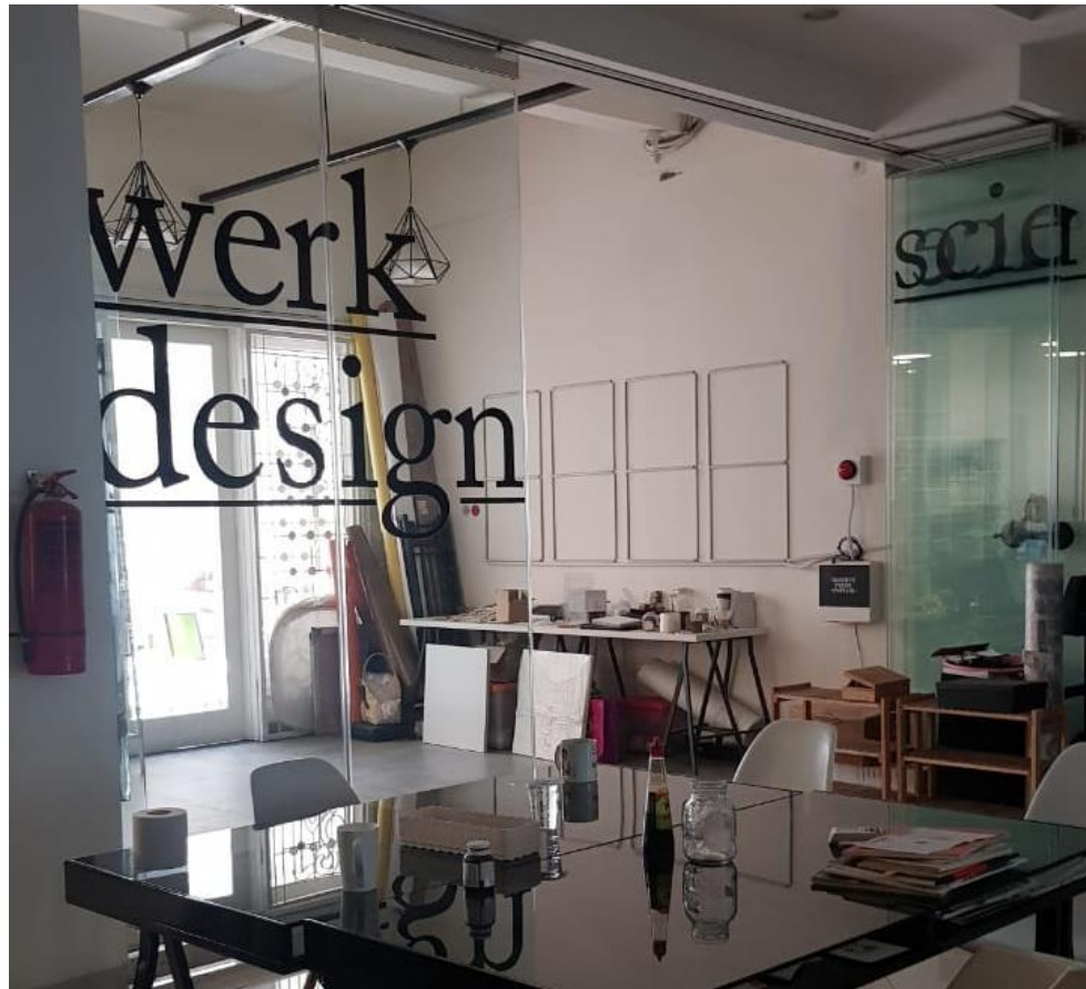
Gambar 2.7 Kantor Sciencewerk