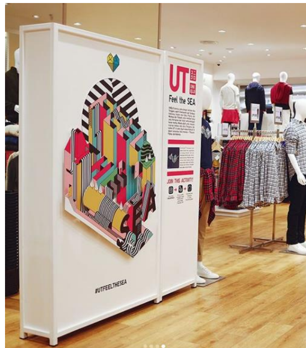
Gambar 2.2 Feel the Sea Uniqlo