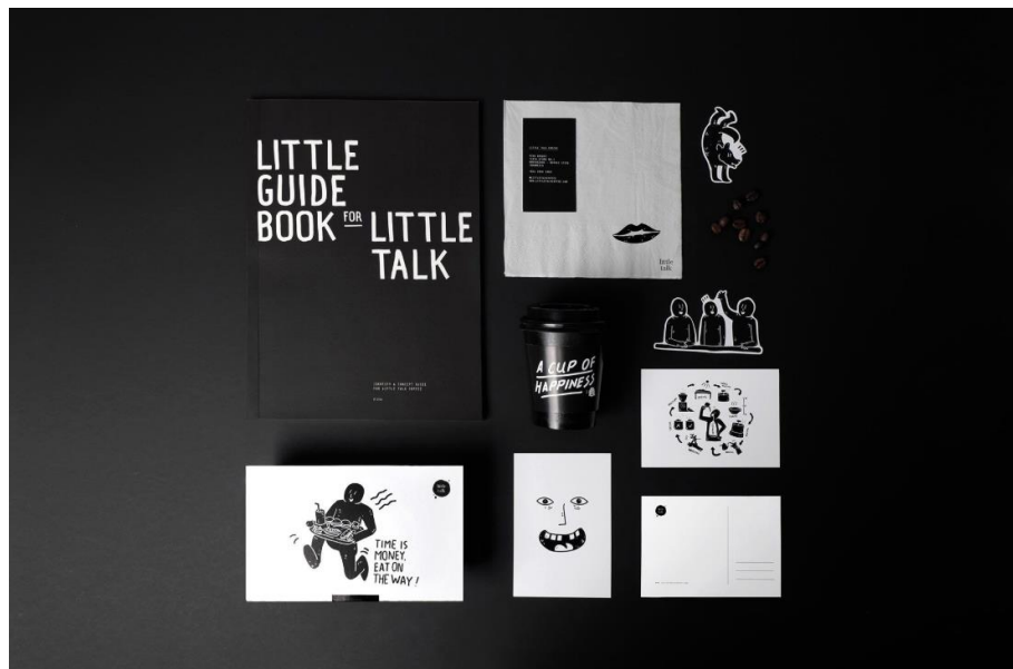
Gambar 2.6 Collateral Little Talk