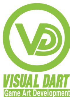
Gambar 2.1. Logo Visual Dart Indonesia

Pertama kali Visual Dart berdiri di Korea Selatan. Seiring berjalannya waktu Visual Dart berkembang dengan baik yang menjadikan Visual Dart mampu melebarkan sayapnya dan masuk ke perindustrian game di Indonesia. Visual Dart membuka cabangnya di Indonesia pada tanggal 28 Januari 2018 di Lyto Game Building . Visual Dart Indonesia bekerja sama dengan perusahaan Lyto Game , publisher game online Indonesia. Lyto Game dipimpin oleh Andy Suryanto. Terpilihnya Indonesia sebagai cabang dari Visual Dart Korea, dikarenakan Visual Dart melihat potensi dan banyaknya talenta yang bisa dikembangkan di Indonesia.