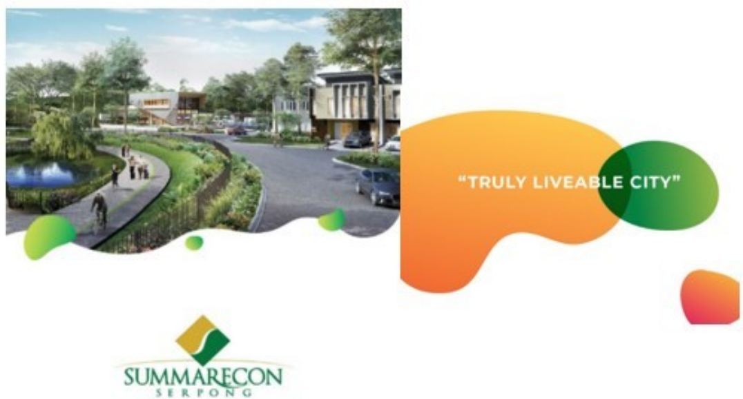
Gambar Error! No text of specified style in document. 2. Aset Visual Summarecon Serpong

Summarecon Serpong adalah salah satu klien dari Dreambox Branding Consultant. Pihak klien menginginkan tampilan dan nuansa baru yang lebih fresh dan bisa menjangkau anak muda, karena sebelumnya Summarecon Serpong terkesan kuno dan kaku. Solusi yang diberikan oleh Dreambox Branding Consultant yakni merevitalisasi brand , yakni merubah elemen desain sebelumnya dengan supergraphic baru berbentuk seperti cairan atau liquid hijau pada contoh diatas agar lebih terlihat lentur dan modern, sehingga dapat menjangkau anak muda juga. Supergraphic cairan hijau tersebut terinspirasi dari bentuk sel manusia, yang selalu bertumbuh dan berkembang, seperti Summarecon Serpong yang diharapkan akan terus bertumbuh dan berkembang.