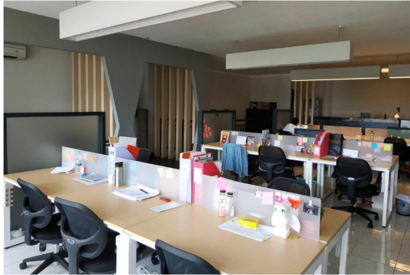
Gambar 2.8. Ruang Kerja Dreambox Branding Consultant

Dreambox Branding Consultant memiliki ruang kerja yang nyaman dan kondusif, sehingga para karyawan nyaman bekerja disana. Jam masuk kerja yaitu jam sembilan pagi sampai jam enam malam, dengan satu jam waktu istirahat. Namun para karyawan tidak harus terpaku pada jam tersebut, jadi jam kerja Dreambox Branding Consultant dapat dibilang fleksibel. Kondisi ruang kerja tidak hening sehingga tercipta suasana kerja yang menyenangkan dan penulis merasakan kekeluargaan yang cukup di Dreambox Branding Consultant.