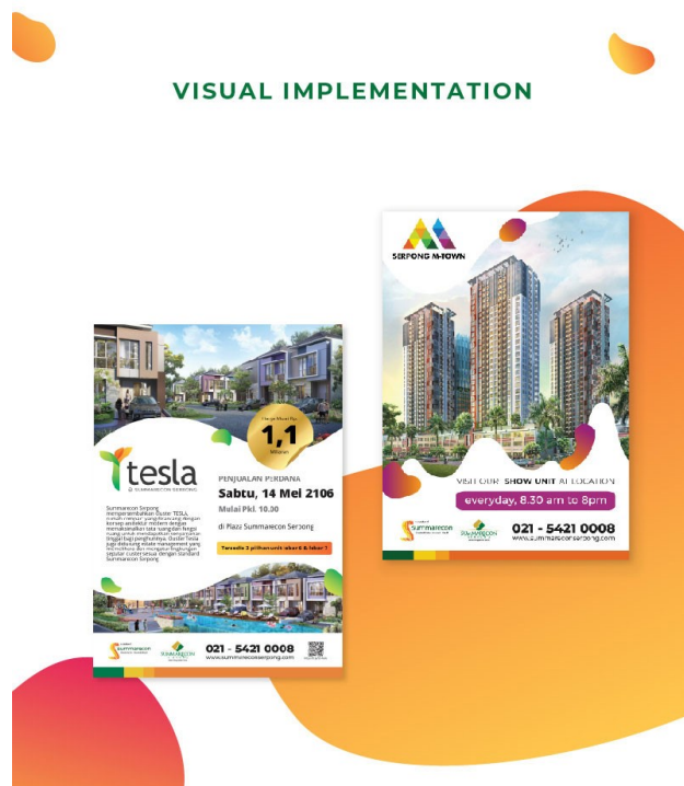
Gambar 2.4. Visualisasi Pamflet Summarecon Serpong