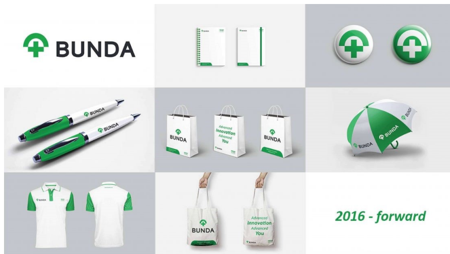
Gambar 2.6. Visualisasi Branding RSIA Bunda