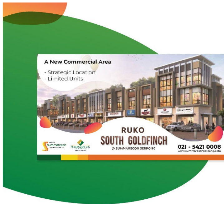
Gambar 2.3. Visualisasi Billboard Summarecon Serpong