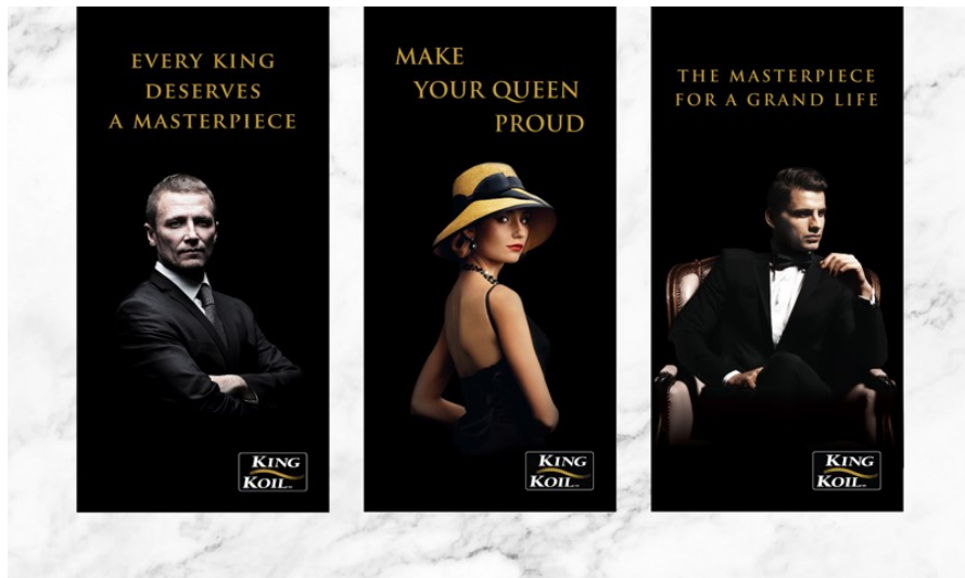
Gambar 2.4. Identitas Visual King Koil