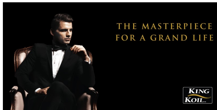
Gambar 2.5. Visualisasi Brand Campaign King Koil

Klien kedua yang penulis jabarkan yaitu King Koil. King Koil adalah brand perlengkapan tidur yang juga adalah klien dari Dreambox Branding Consultant. Pihak klien menginginkan King Koil menjadi pilihan pertama masyarakat dalam memilih perlengkapan tidur seperti ranjang, bantal, dan sebagainya. Maka dari itu, Dreambox memberikan solusi yaitu lebih mengedepankan emotional benefit sehingga dapat mempererat hubungan dan membangun kepercayaan King Koil dengan pelanggan. Dreambox melihat potensi pelanggan sebagai raja, setiap raja berhak mendapatkan yang terbaik sehingga konsep tersebut dijadikan konsep yang tepat dan cocok untuk King Koil.