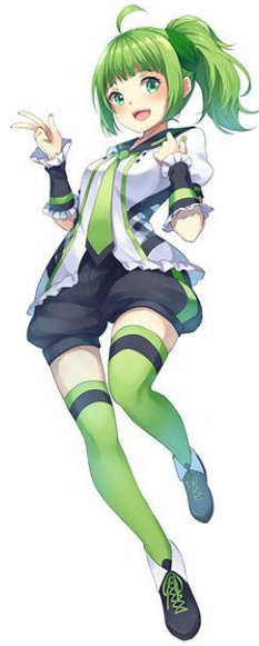
Gambar 2.2. Vtuber Mintchan