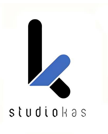
Gambar 2.2. Logo StudioKAS (2012-2018)