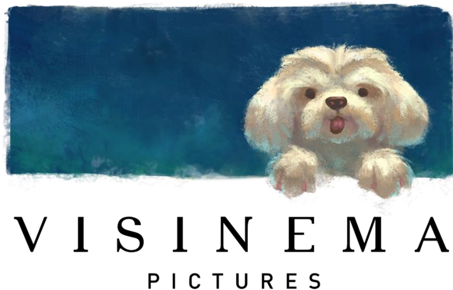
Gambar 2.1 Logo Visinema Pictures

Visinema Pictures adalah sebuah PH yang didirikan tahun 2008 dengan CEO seorang Sutradara Indonesia yang bernama Angga Dwimas Sasongko.