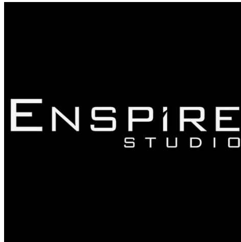
Gambar 2.1. Logo Enspire Studio