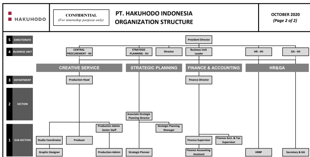
Tabel 2.2 Struktur Organisasi Hakuodo Indonesia