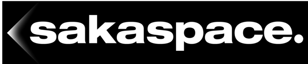
Gambar 2.1. logo Sakaspace