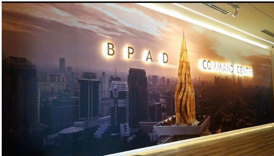
Gambar 2.2 Tampak Depan Kantor BPAD

Badan Pengelolaan Aset Daerah (BPAD) provinsi DKI Jakarta adalah Lembaga pemerintahan yang bergerak di bidang akuntabilitas pengelolaan barang milik daerah Provinsi DKI Jakarta. BPAD merupakan unsur fungsi penunjang urusan pemerintahan bidang keuangan pada sub bidang pengelolaan aset, yang dipimpin oleh seorang Kepala Badan yang berkedudukan di bawah dan bertanggung jawab kepada Gubernur melalui Sekretaris Daerah, BPAD dalam melakukan tugas dan fungsinya