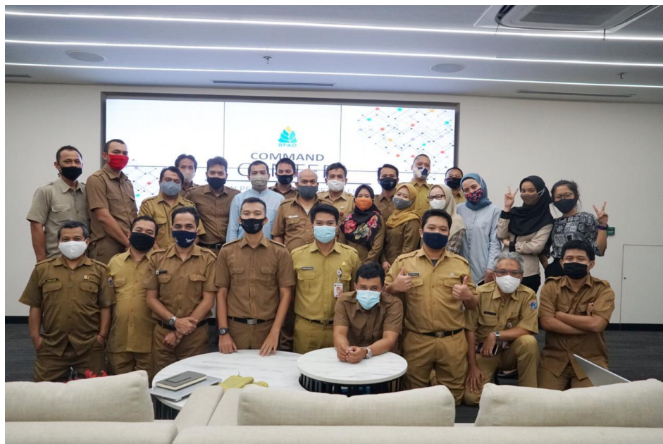
Gambar 2.4 Foto Bersama Sub Bidang Data dan Informasi