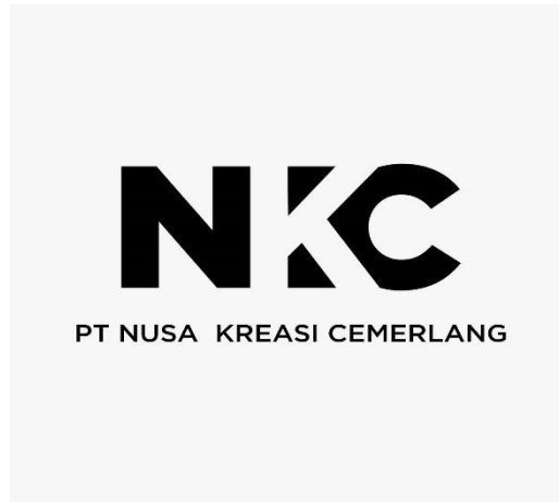
Gambar 2.1 Logo Nusa Kreasi Cemerlang

PT Nusa Kreasi Cemerlang merupakan sebuah perusahaan start-up . PT Nusa Kreasi Cemerlang tergabung ke dalam Ottodigital Group yang memiliki fokus pada layanan digital marketing serta software house bagi para perusahaan. Layanan utama dari NKC adalah layanan pembuatan sebuah platform bisnis untuk perusahaan. Selain itu NKC juga menyediakan layanan digital marketing untuk platform bisnis menggunakan tools , seperti google analytics , google adwords , dan tools marketing sejenisnya.