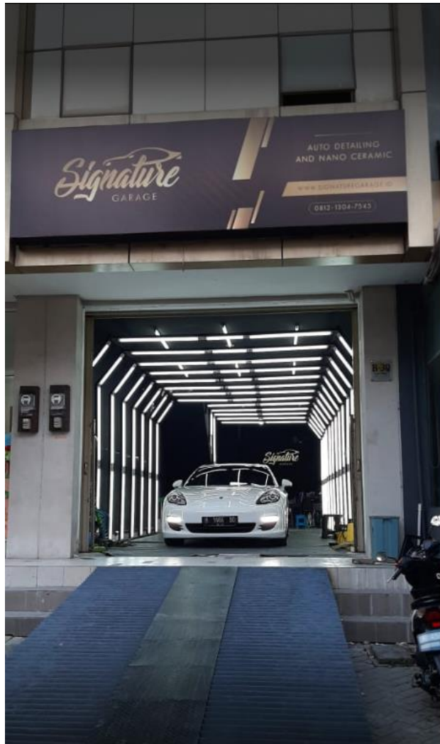
Gambar 2.1. Lokasi Signature Garage

Signature Garage merupakan sebuah perusahaan yang berjalan di bidang otomotif dengan memberikan layanan coating dan detailing mobil. Signature Garage Berdiri sejak tahun 2018. Media sosial yang digunakan oleh Signature Garage antara lain Youtube, Instagram, Facebook, Twitter, dan Whatsapp. Selain itu, Signature Garage juga memiliki toko di Tokopedia. Signature Garage memiliki website di www.signaturegarage.id dan email signaturegarageid@gmail.com .