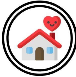
Gambar 2.7 Teras Home