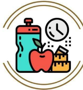
Gambar 2.6 Teras Fit