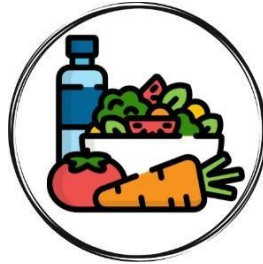
Gambar 2.3 Teras FnB