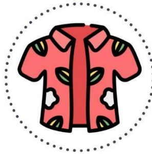
Gambar 2.5 Teras Style