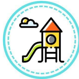
Gambar 2.4 Teras Fun