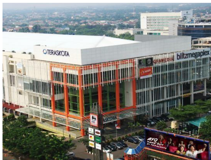
Gambar 2.1 Teraskota Entertainment Center

Teraskota Entertainment Center merupakan sebuah pusat perbelanjaan yang terletak di Jalan Pahlawan Seribu CBD Lot VII B, Bumi Serpong Damai, Tangerang Selatan yang mulai beroperasi sejak Agustus 2009. Teraskota dimiliki oleh PT. Deyon Resources yang di dalamnya terdapat manajemen yang membangun Teraskota Entertainment Center dengan lahan seluas 2 hektar, memiliki 2 lantai pusat perbelanjaan dan 1 lantai parkir basement . PT. Deyon Resources selain mengelola Teraskota Entertainment Center , memiliki Hotel Santika BSD yang lokasinya langsung terhubung satu sama lain. Tenant yang dimiliki Teraskota antara lain Gramedia, CGV Blitz, Celebrity Fitness, Superindo, Starbucks, Samsung Store, ACE Hardware, dan lainnya.