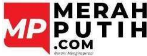
Gambar 2.1 Logo PT Merah Putih Media