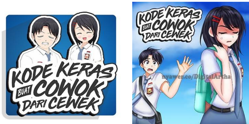
Gambar 2.2. Project yang dikerjakan PT. Global Digital Artha

Perusahaan ini sudah merilis banyak mobile game , dan salah satu diantaranya yang paling terkenal adalah “Kode Keras Cowok dari Cewek”, yang merupakan visual novel . Menurut Satrio dan Gafur (2017), Visual novel merupakan game dengan format story telling yang didalamnya terdapat unsur multimedia seperti gambar, teks suara dan video. Game berjenis visual novel ini memberikan kesempatan bagi pemainnya untuk memilih berbagai pilihan yang dapat menentukan alur dan dialog dengan sedemikian rupa agar dapat memotivasi pemainnya untuk mendalami kisah yang ada di dalam game tersebut. Mobile game ini sampai sekarang masih dikembangkan oleh Digital Artha, dan Digital Artha juga mengadaptasi game ini menjadi sebuah webcomic dengan judul yang sama. Webcomic sendiri adalah sebuah komik yang dipublikasikan secara online melalui situs web ataupun aplikasi tertentu.