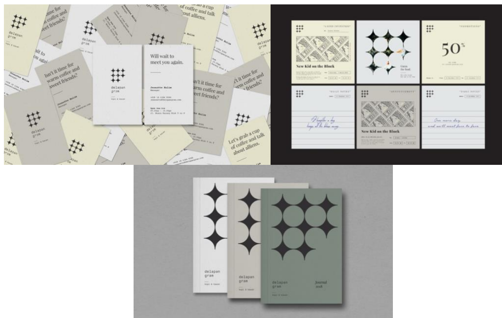
Gambar 2. 2. Brand Identity dan Social Media Delapan Gram ( https://studioyord.com/project/delapan-gram )

Studio Yord merupakan studio desain yang menawarkan jasa “ crafting brands ” dan “ developing brand ”. Karya dari jasa yang ditawarkan diantaranya berupa branding seperti Louven, Delapan Gram, Martabak Bebelim, Coromandel, Everyday C+, dan proyek-proyek lainnya. Berikut adalah hasil dari karya studio Yord yaitu Delapan Gram. Delapan Gram adalah sebuah kedai kopi yang terletak di Jakarta Utara. Delapan Gram dibangun oleh delapan orang yang memiliki persahabatan yang erat. Pendiri Delapan Gram menciptakan kedai kopi tidak hanya menjadi tempat untuk memanjakan lidah orang, tetapi juga sebagai tempat untuk berbagi cerita satu sama lain dan saling menginspirasi. Delapan Gram percaya bahwa setiap orang memiliki “ spark ” tersendiri, dimana setiap orang memiliki peran yang tak tergantikan dalam membentuk Delapan Gram (Studio Yord, 2021).