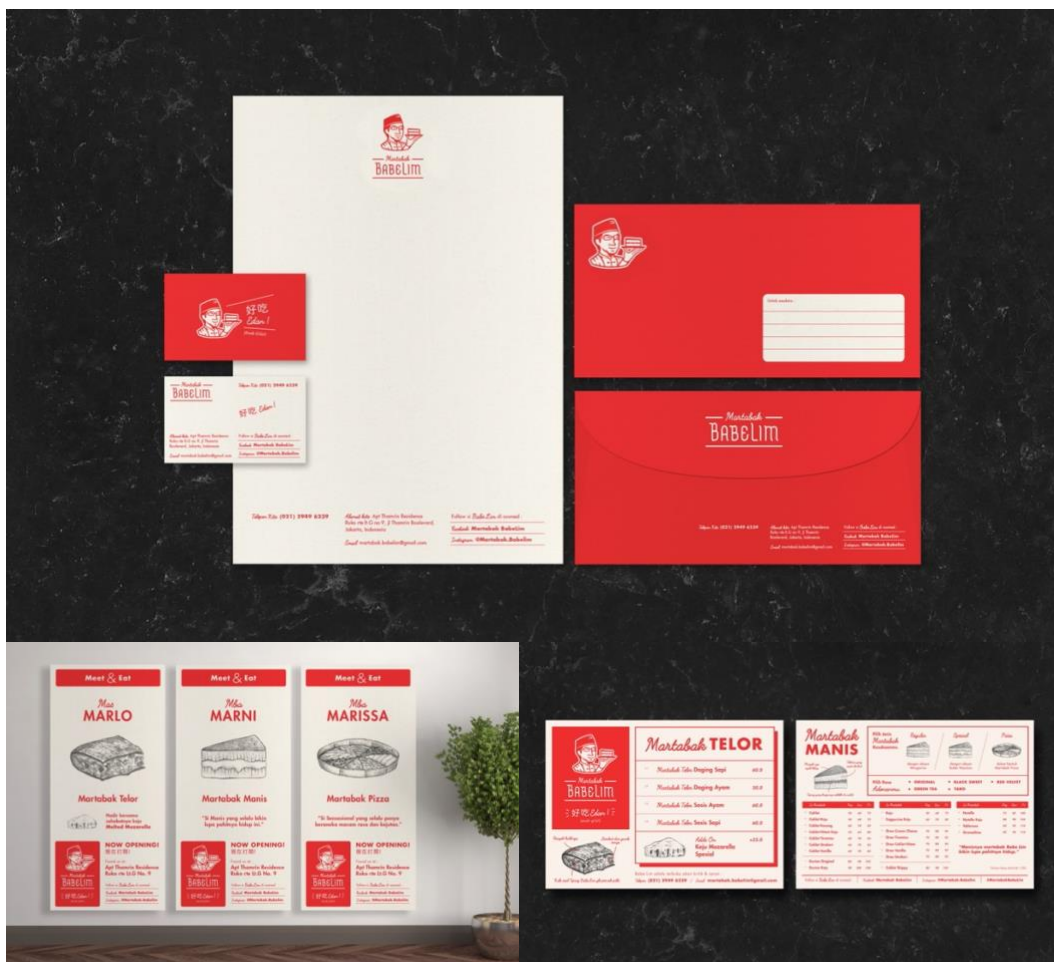
Gambar 2. 3. Brand Identity Martabak Bebelim ( https://studioyord.com/project/martabak-babelim-duplicate )

Martabak Babelim adalah salah satu tempat makan yang menawarkan berbagai pilihan martabak. Babelim menggabungkan lezatnya antara masakan Cina dan masakan Jawa menjadi satu lezat baru. Konsep yang dihadirkan cukup mudah tertuju yaitu menampilkan sisi elemen kultural Cina dan Jawa dalam desain dan copywriting . Berikut adalah portofolio hasil karya Studio Yord Martabak Babelim: