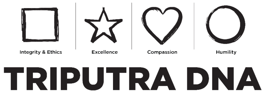
Gambar 2.2. Nilai-nilai Perusahaan Triputra, Triputra DNA

berkualitas di berbagai aspek. Dengan menggerakkan visi dan misi perusahaan, Insan Triputra menciptakan nilai-nilai perusahaan yang dapat disebut Triputra DNA.