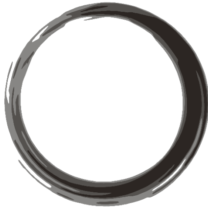
Gambar 2.6. Humility , Triputra DNA

Humility atau kerendahan hati, merupakan wujud kerendahan hati yang diawali dengan mengalahkan ego sepenuhnya untuk menciptakan keterbukaan diri serta kesadaran diri demi tercapainya sebuah kemajuan diri Insan Triputra. Nilai Humility memiliki perilaku kunci, yaitu: