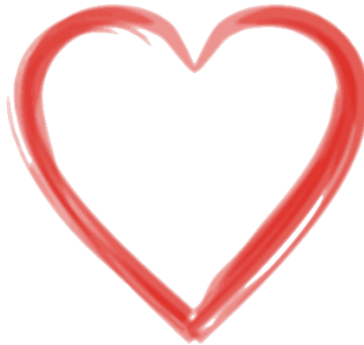
Gambar 2.5. Compassion , Triputra DNA

Compassion atau kewelasasihan, merupakan landasan bertindak bagi Insan Triputra dalam mengedepankan sikap kepedulian terhadap sesama, memberi mereka tujuan yang lebih mulia daripada diri sendiri dalam kehidupan sehari-hari. Compassion memiliki perilaku kunci, yaitu: