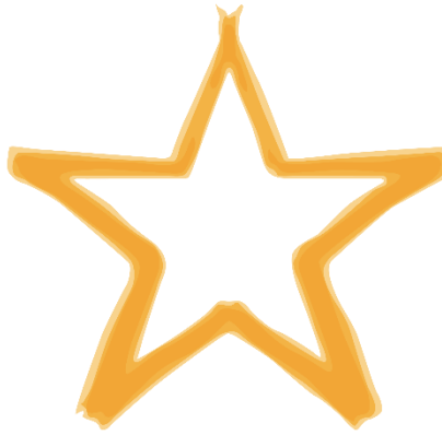
Gambar 2.4. Excellence , Triputra DNA

Excellence atau keunggulan, bermakna sebagai nilai yang mengingatkan setiap Insan Triputra untuk terus menghasilkan karya lebih dari yang diharapkan dalam berbagai situasi. Keunggulan juga memberi nilai sebagai dorongan bagi Insan untuk mengejar prestasi yang terbaik dan membanggakan bagi mereka. Perilaku kunci dari Excellence , yaitu: