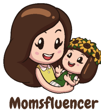
Gambar 2. 1. Logo Momsfluencer