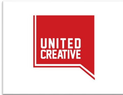
Gambar 2.3. Logo United Creative

partner mengembangkan keinginannya dan United Creative selalu berusaha untuk mewujudkannya.