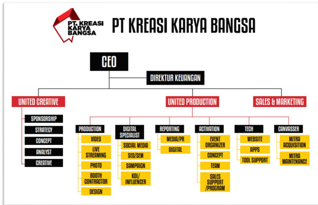
Gambar 2.5. Struktur Organisasi United Creative

United Creative memiliki struktur dibawah payung PT Kreasi Karya Bangsa. Berikut adalah gambar struktur organisasi di United Creative .