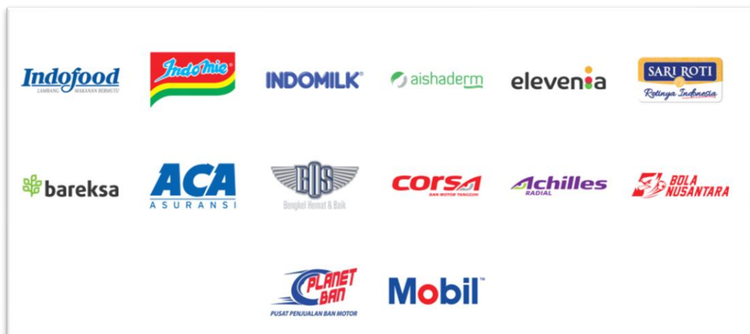
Gambar 2.1. Klien dari United Creative