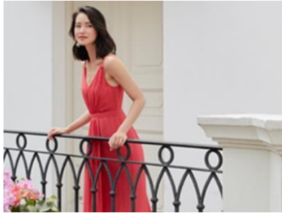
Gambar 2.1.3. Shop by Style - Work Wear Love, Bonito