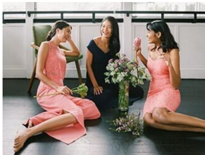
Gambar 2.1.4. Collections - LYLAS Love, Bonito