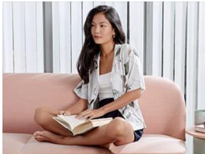
Gambar 2.1.5. Collections - Loungewear Love, Bonito