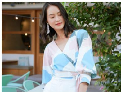
Gambar 2.1.2. Shop by Style - Casual Love, Bonito

Melalui online dan offline store nya Love, Bonito memiliki tujuan untuk menjadi brand fashion terbaik bagi wanita asia dengan memberikan pelayanan terbaik kepada seluruh pelanggan. Pelayanan yang diberikan oleh Love, Bonito adalah layanan obrolan langsung melalui whatsapp dan direct message instagram untuk memudahkan para pelanggan melakukan transaksi. Selain itu Love, Bonito juga memberikan layanan gratis tarif pengiriman ke seluruh Indonesia melalui online website . Layanan lainnya yang diberikan Love, Bonito adalah promo kusus dan potongan harga, promo dengan menggunakan kartu kredit dari bank tertentu, dan sistem pengembalian produk apabila ada ketidaksesuaian.