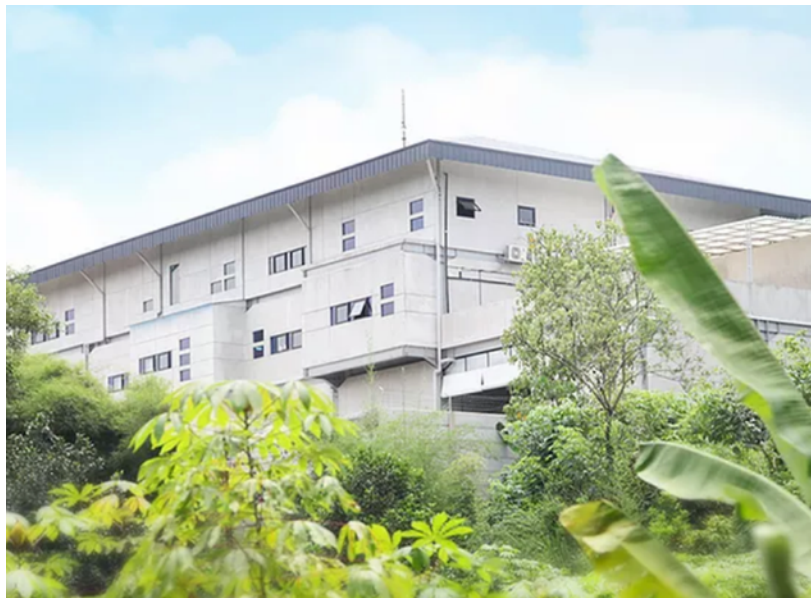
Gambar 2.1 PT Acom Digital Kreasi

PT Acom Digital Kreasi berdiri sejak 2017 yang berfokus meningkatkan keterlibatan merek klien pada audiens yang tepat. PT Acom Digital Kreasi berada di Jl, Masjid Gang. Pamona No. 179 RT 009, RW 010, Ciater, Serpong, Tangerang. PT Acom Digital Kreasi secara konsisten membuat konten visual dan video yang menarik, influence , dan menginsirasi pada beberapa media sosial, seperti Instagram, Facebook, dan Youtube. Dalam membuat proses kreatif PT Acom Digital Kreasi selalu mengikuti trend yang ada, memberikan solusi yang kreatif, dan implementasi yang optimal. Selain itu, PT Acom Digital Kreasi juga selalu melibatkan klien dalam setiap prosesnya. Klien yang ditangani oleh PT Acom Digital Kreasi adalah Confident, Sinbad Alama, Geliga, Probio C, NR Hair Pro, Mylea, BHO, Mea, Bakmi GM, Ifree, CLKP, dan Yeo's,