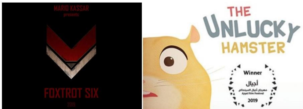
Gambar 2.1 . Film Foxtrot Six dan animasi pendek The Unlucky Hamster

Sebagai sebuah studio animasi yang berbasis di Jakarta yang berdiri sejak 2006, Lumine Studio telah memiliki pengalaman lebih dari 10 tahun dalam menghasilkan karya dengan kualitas tinggi. Dengan reputasi tersebut, Lumine Studio sudah dipercaya klien untuk menyajikan beragam karya animasi 3D dengan berbagai platform digital sesuai kebutuhan. Dari kebutuhan kampanye digital, produksi game , serial animasi, hingga film layar lebar, Lumine Studio telah berpengalaman dalam menyajikannya dengan standar kualitas tinggi yang profesional.